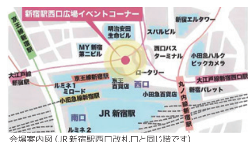
会場案内図 (JR新宿駅西口改札口と同じ階です)

*一部のプログラムについて時間・内容が変更されることがあります。ご了承ください。