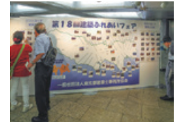
東京の景観・ポストカード展