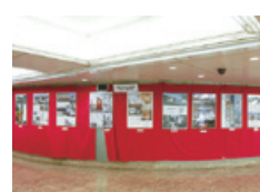
東京建築賞受賞作品展