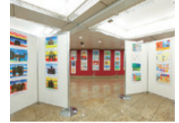
児童画コンテスト