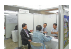
建築なんでも相談会