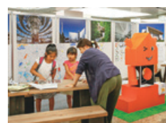
建築ワンダーランド