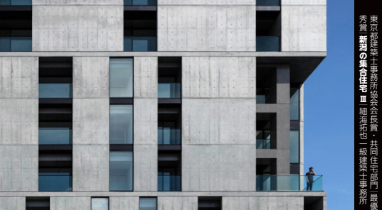
東京都庁新庁舎(仮称)「新庁舎」(東京都庁) 建築士事務所 建築士事務所