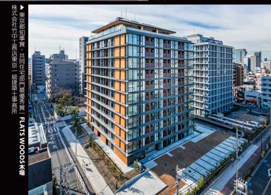
▶ 東京都知事賞・共同住宅部門最優秀賞 | ELVIS WOODS賞 株式会社竹中工務店東京一級建築士事務所