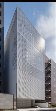
▼ 新人賞・一般一類部門最優秀賞 | BONUS TRACK 株式会社ツバメアーキテクト一級建築士事務所