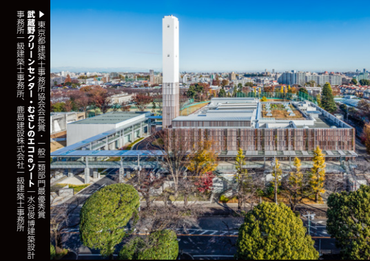
◀ 一般一類部門優秀賞 | カンダホールディングス本社 株式会社竹中工務店東京一級建築士事務所