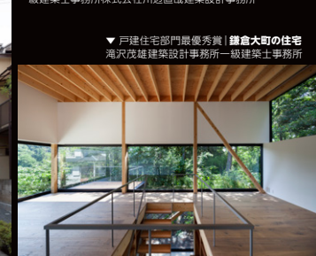
▼ 戸建住宅部門最優秀賞 | 鎌倉大町の住宅 滝沢茂雄建築設計事務所一級建築士事務所