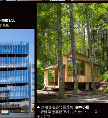
▲ 戸建住宅部門優秀賞 | 森の小屋 一級建築士事務所株式会社ケイ・エスアーキテクト