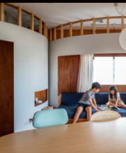
◀ 戸建住宅部門優秀賞 | 上井草の住宅 一級建築士事務所株式会社川辺直哉建築設計事務所