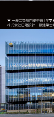
▼ 一般二類部門優秀賞 | ヤマト滞南ビル 株式会社日建設計一級建築士事務所