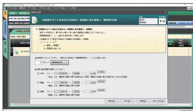
床面積等の入力画面