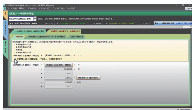
追加業務の業務人・時間数算定条件の設定画面