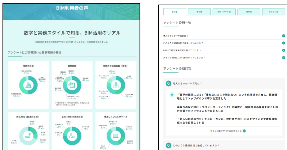
画像：BIM 利用者の声（アンケート調査結果掲載ページ）

回答者の事務所形態は総合事務所約 51%、専門事務所約 44%で、BIM 使用年数 5 年以上が約 78%と定着・活用期にあるユーザーの声が多く集まった。企画提案や基本設計で BIM 導入による時間削減効果を実感する層が存在する一方、確認申請等の工程では BIM 活用が十分に進んでいないことが判明した。制度面では、補助金・金銭的支援の拡充を求める声が多（11 件）で、発注要件への組み込みなど制度環境整備への要望が強いことが確認された。