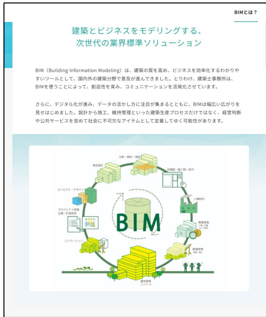
画像左：改修前 BIM とは？