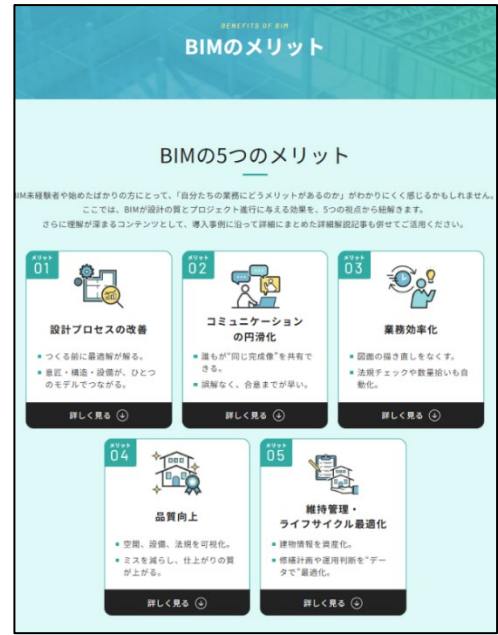
画像：新規コンテンツページのスクリーンショット（一部）