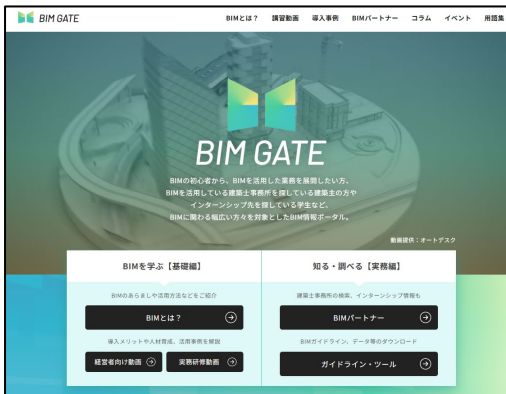
画像左：改修前 TOP ページ

既存の「企業目線」のナビゲーションを「ユーザー目線」に転換し、グローバルナビゲーションを「初めての BIM」「導入ステップ」「BIM を学ぶ」「事例を見る」「お役立ち情報」の 5 カテゴリに再設計した。トップページは BIM 導入を段階的に理解できるストーリー性のある構成とし、ページ間の回遊性を高めるリンク設計を施した。既存コラムは「BIM 初心者ガイド」と「ナレッジベース」に再分類し、「よくある質問」を課題解決の入口として位置付けた。