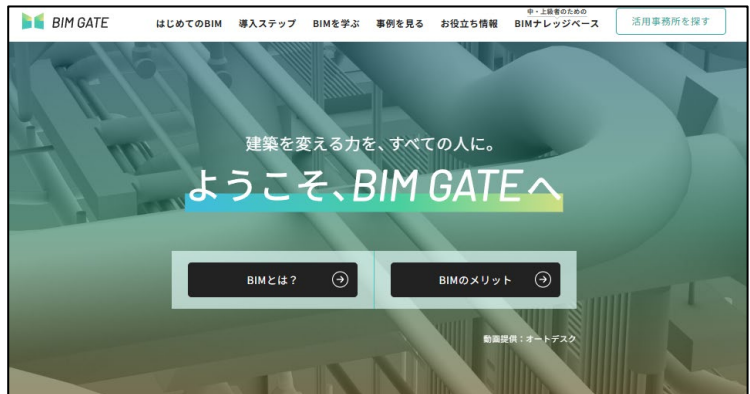
画像右：改修後 TOP ページ